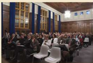
Das Publikum der Lesung im Schwurgerichtssaal 600 des Landgerichts Nürnberg

Diese Lesung war eine einmalige Gelegenheit, einen Pionier des Simultandolmetschens zu erleben und auch einige Fragen zu stellen. Anschließend signierte Siegfried Ramler sein Buch „Die Nürnberger Prozesse. Erinnerungen des Simultandolmetschers Siegfried Ramler“, das 2010 im Verlag Martin Meidenbauer aus München erschienen ist. Abgerundet wurde die Veranstaltung mit einem kleinen Buffet des Bundesverbandes der Dolmetscher und Übersetzer e.V. (BDÜ), LV Bayern, und interessanten Gesprächen mit Kollegen.